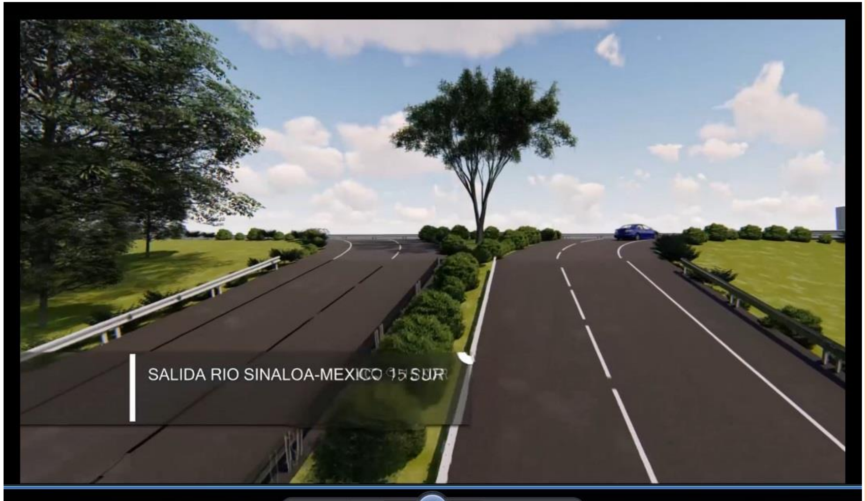
VISTA DE LA CALZADA R. CERVANTES A- HACIA LA SALIDA SUR