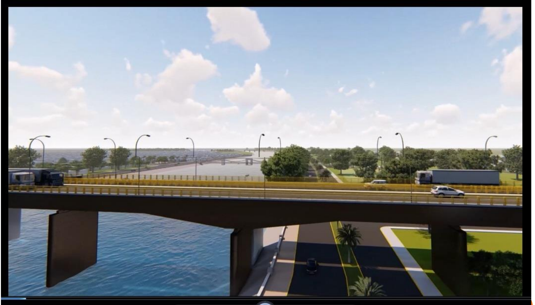
PUENTE NUEVO SOBRE EL RIO SINALOA