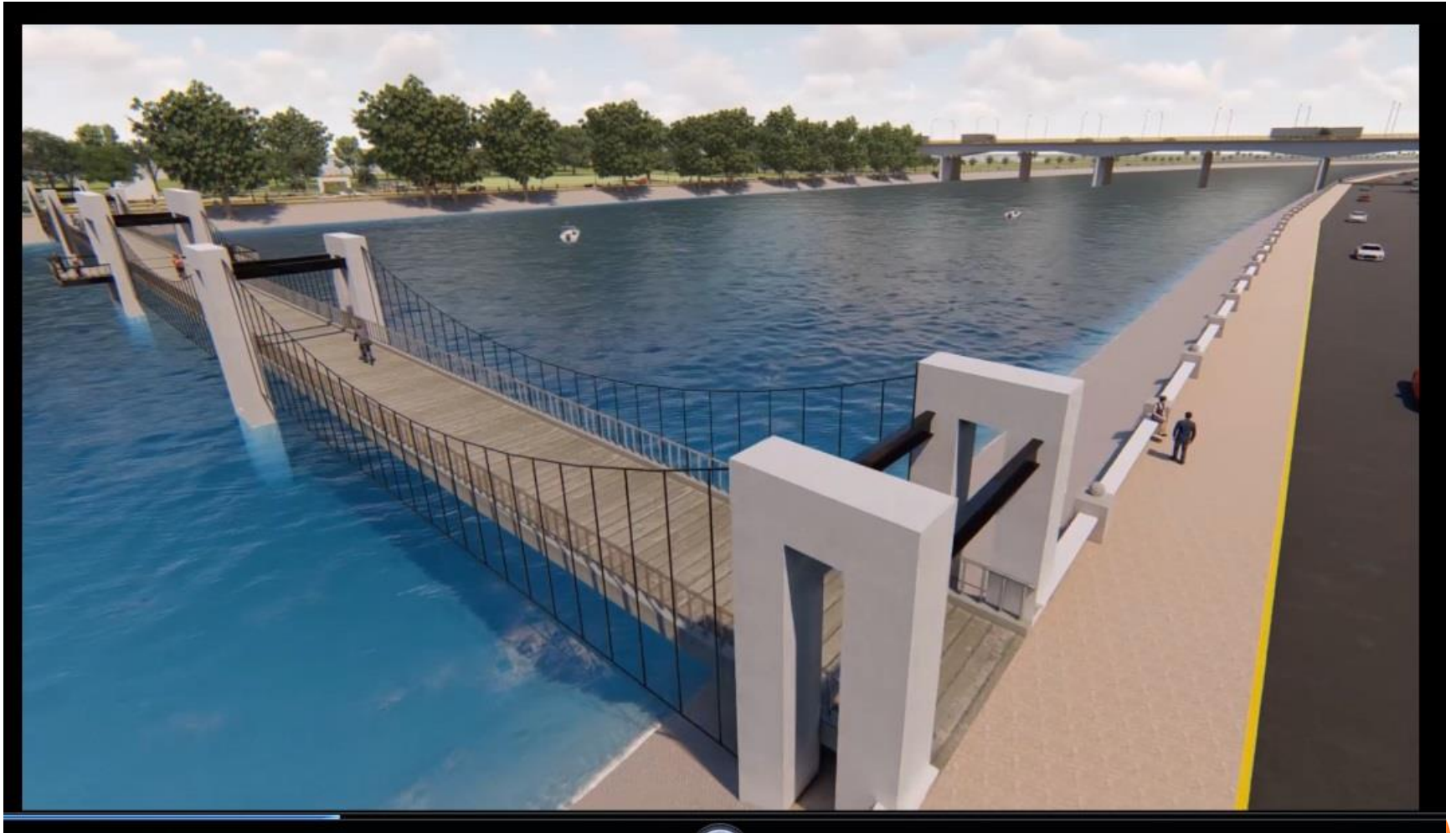
PUENTE PEATONAL SOBRE EL RIO SINALOYA