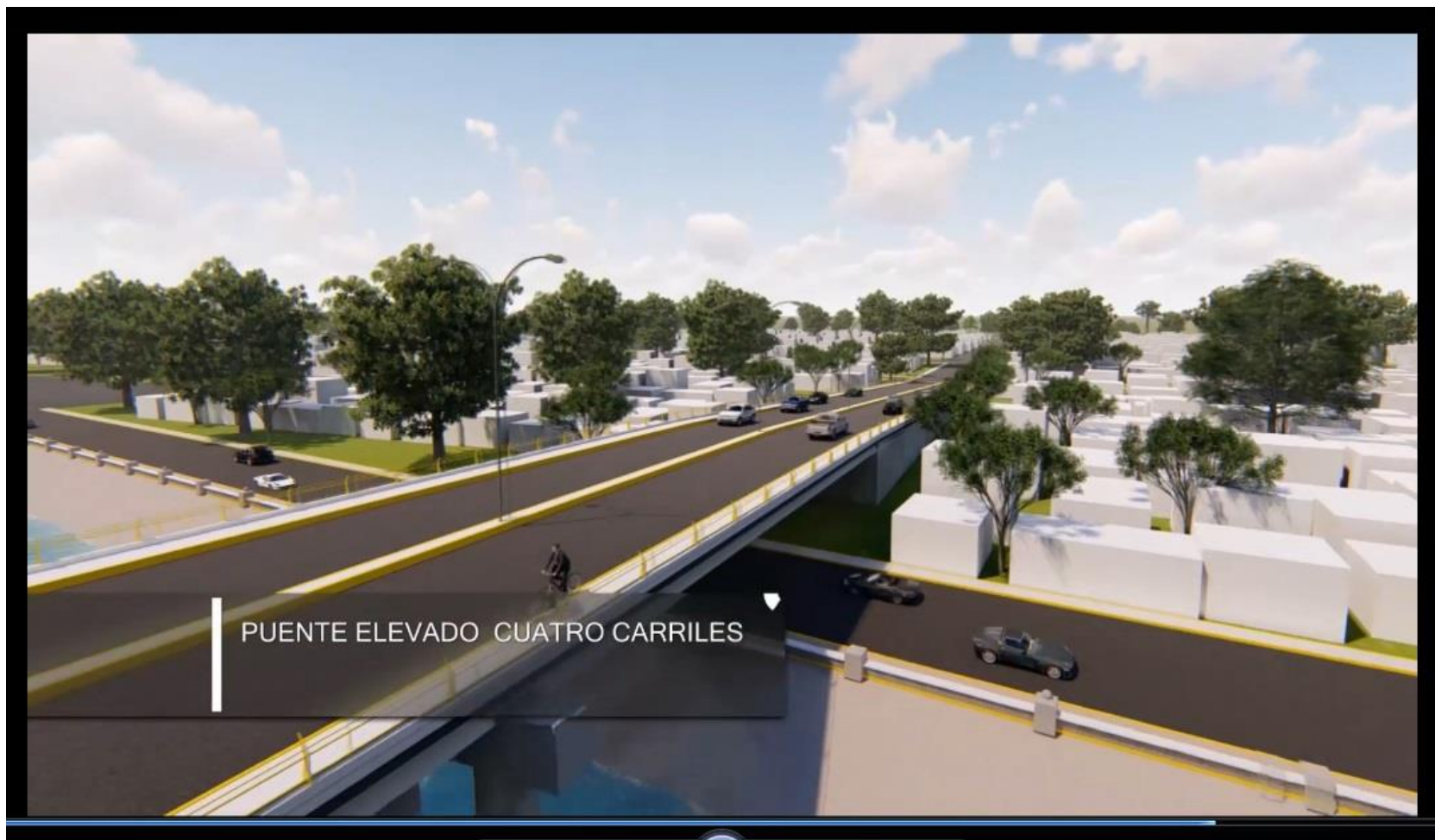
VISTA DEL RIO HACIA LA CALLE CUAUHEMOC