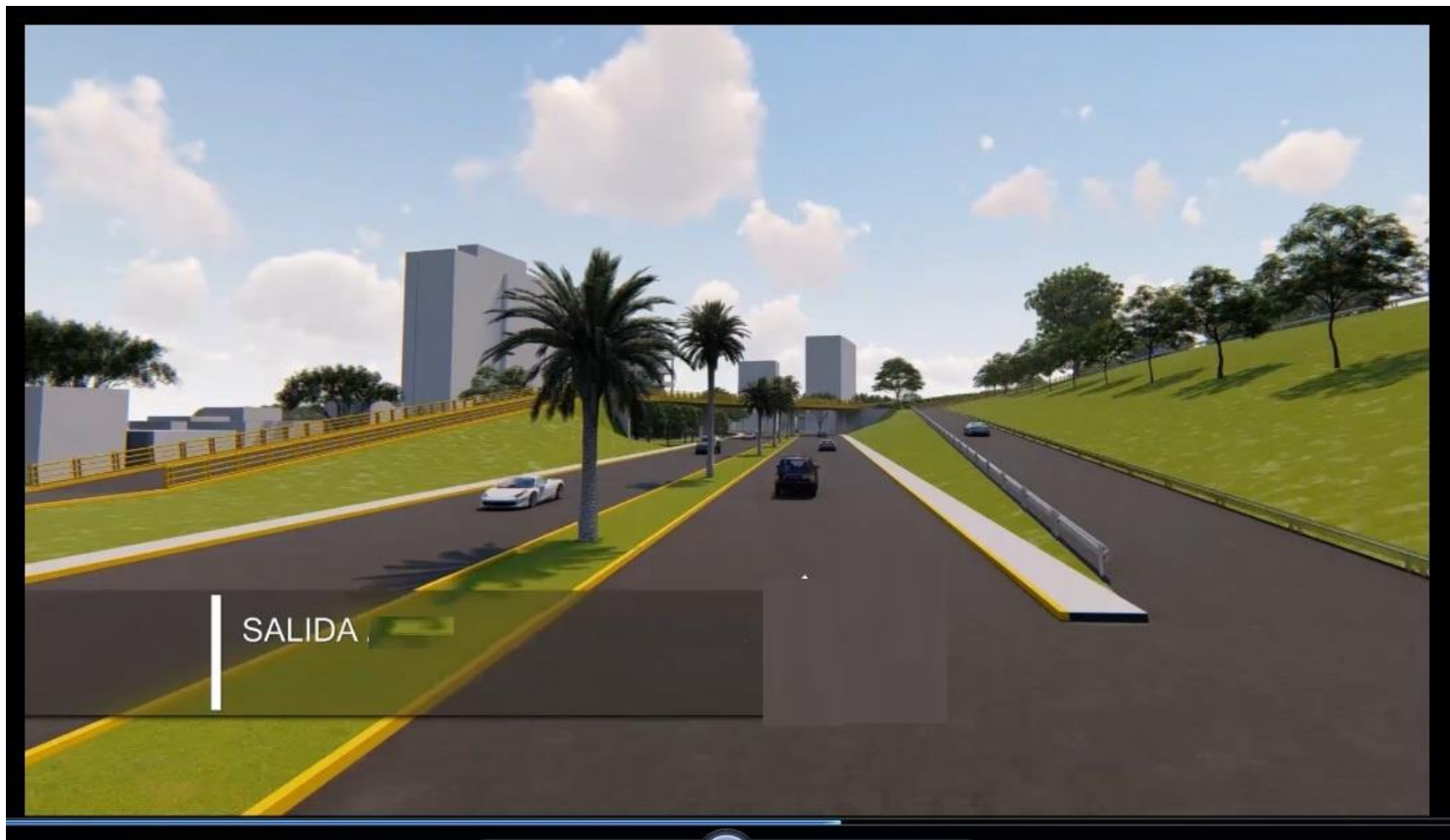
SALIDA DE LA CARRETERA HACIA CRUCE DE LA MISMA